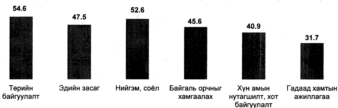
График 1.Монгол Улсын бүсчилсэн хөгжлийн үзэл баримтлалын хэрэгжилт, зорилтоор

Дээрх 6 зорилтын хэрэгжилтэд хяналт-шинжилгээ, үнэлгээ хийж, зорилт тус бүрээр хэрэгжилтийг харуулбал: