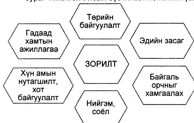
Зураг 1.Монгол Улсын бүсчилсэн хөгжлийн үзэл баримтлалын зорилт

Дээрх 6 зорилтын хэрэгжилтэд хяналт-шинжилгээ, үнэлгээ хийж, зорилт тус бүрээр хэрэгжилтийг харуулбал: