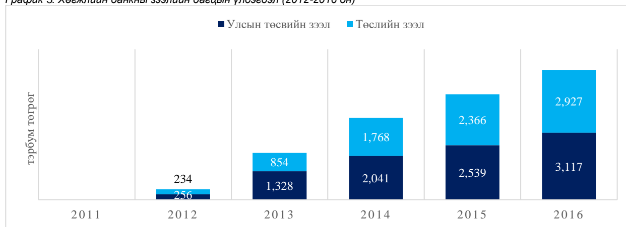
График 3: Хөгжлийн банкны зээлийн багцын үлдэгдэл (2012-2016 он)

2016 оны эцэст банкнаас олгосон нийт зээлийн багцын үлдэгдэл 6,044 тэрбум төгрөгт хүрч өссөн ба нийт багцын үлдэгдлийн 50-аас дээш хувийг улсын төсвөөс эргэн төлөгдөх нөхцөлтэй төсөл, хөтөлбөр эзлэх болсон. Өөрөөр хэлбэл, улсын төсвөөс эргэн төлөгдөх нөхцөлтэй зээлийг банкны эх үүсвэр бусад харьцаа үзүүлэлтийг тооцолгүйгээр их хэмжээтэй олгосон нь төсвийн шинжтэй үйл ажиллагааг хэрэгжүүлэгч байгууллага гэж хэлж болохоор хэмжээнд хүргэсэн.